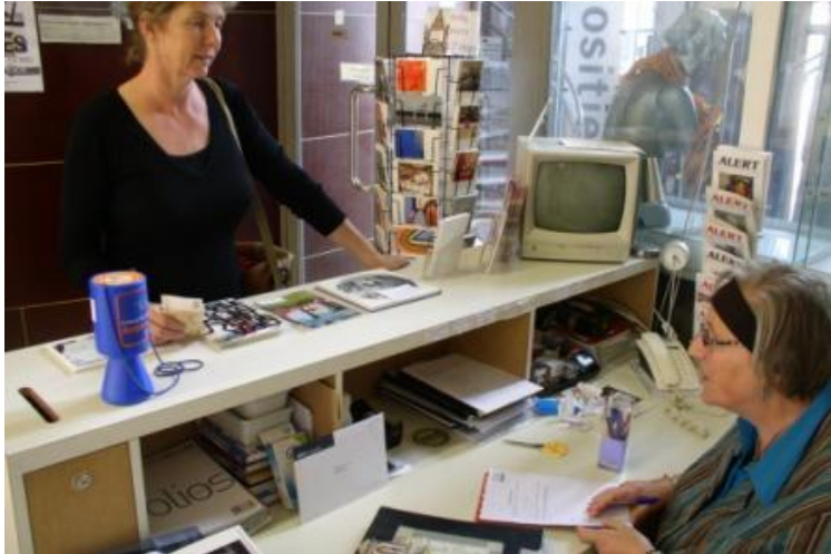
Verkoop expositie Multiple

verkoopcommissie - dit te verhogen door gerichte verkoopexposities te organiseren.