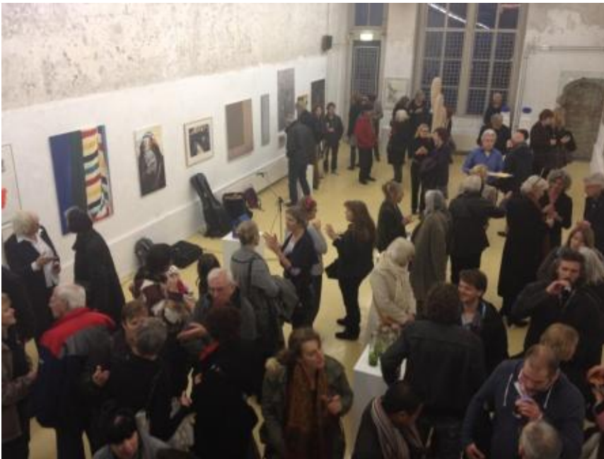
Opening ledententoonstelling december 2011

De leden vormen de basis van de vereniging. Alles wordt door de leden georganiseerd. De vereniging vergroot de binding met leden en tussen de leden onderling. De vereniging organiseert activiteiten en werkt aan een sfeer waardoor iedereen bereid is, zich in te zetten en aanwezig te zijn in de Boterhal. De kunstenaars ontmoeten elkaar waarbij zij vakkennis, beroepsondersteunende kennis en cultureel ondernemerschap delen. Door uitwisseling ontstaan meer mogelijkheden voor exposities en vakverbreding en niveau verhoging.